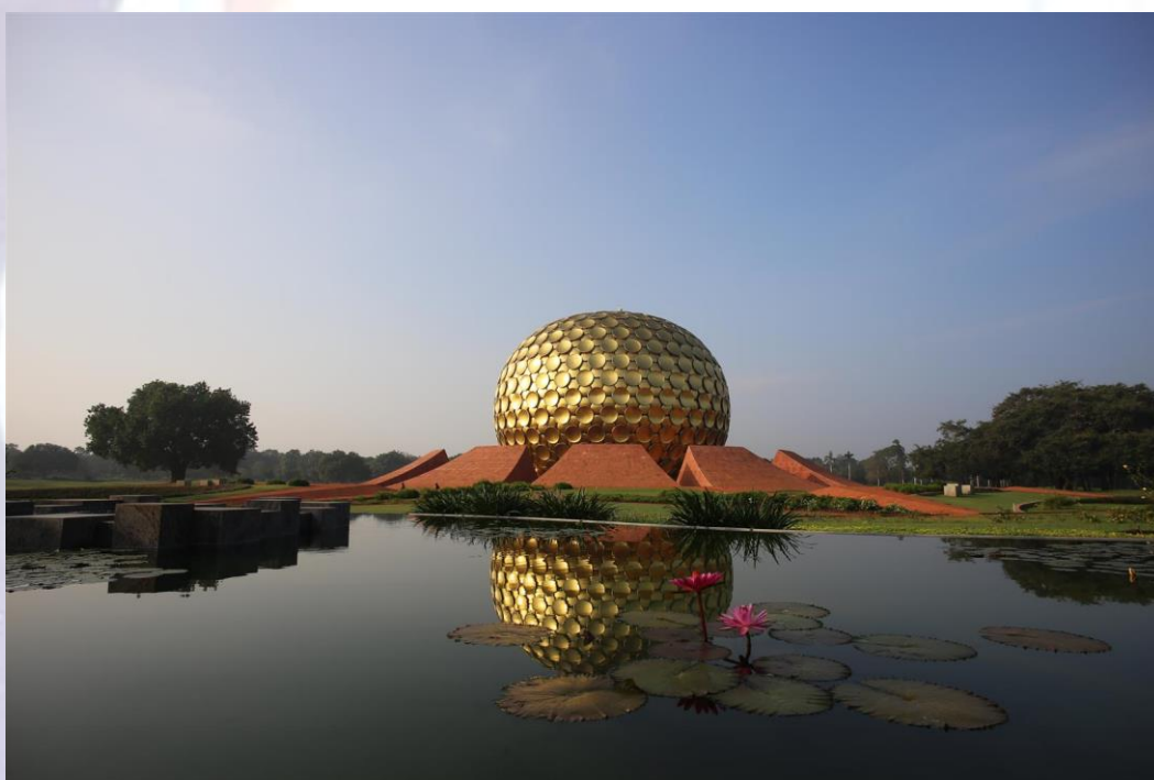
Matrimandir en Auroville